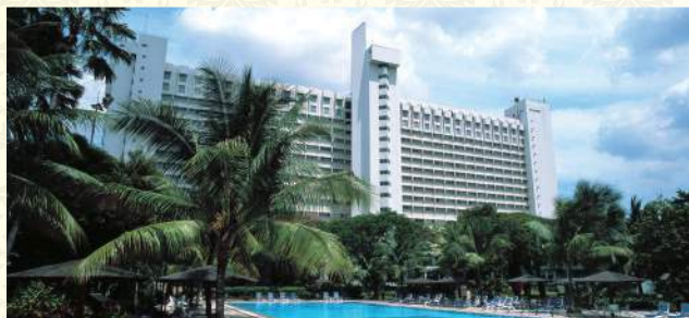
Hotel Borobudur Jakarta