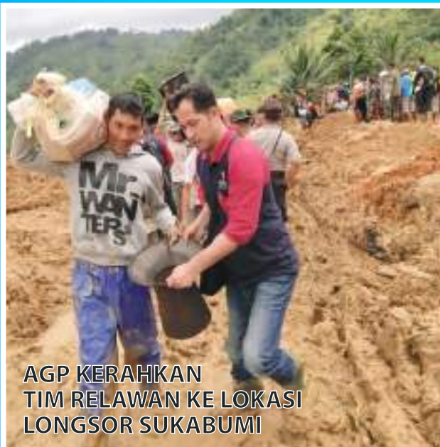
AGP KERAHKAN TIM RELAWAN KE LOKASI LONGSOR SUKABUMI