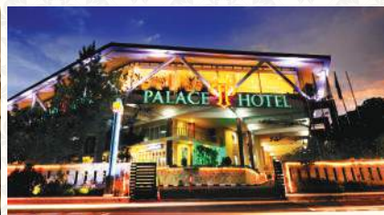
Palace Hotel Cipanas