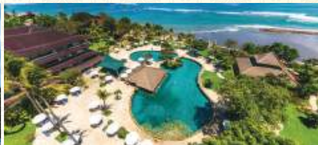
Discovery Kartika Plaza Hotel Bali