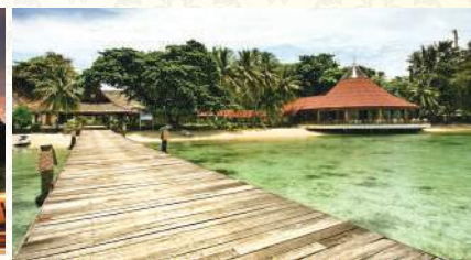
Pulau Seribu Marine Resorts, Pantara Island