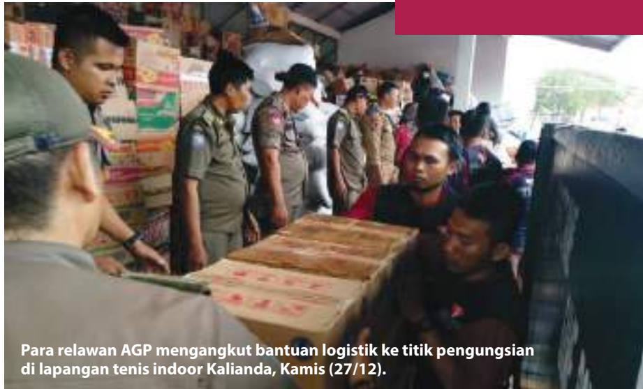
Para relawan AGP mengangkut bantuan logistik ke titik pengungsian di lapangan tenis indoor Kalianda, Kamis (27/12).