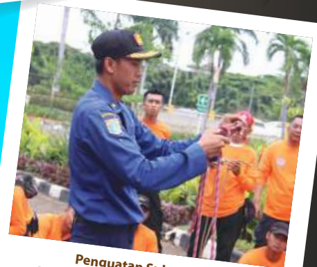
Penguatan Sukarelawan Bentuk Kolaborasi Penanggulangan Bencana Multipihak

9 Penguatan Sukarelawan Bentuk Kolaborasi Penanggulangan Bencana Multipihak