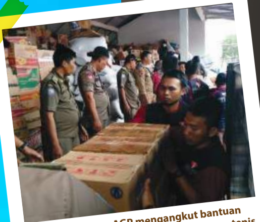
Para relawan AGP mengangkut bantuan logistik ke titik pengungsian di lapangan tenis indoor Kalianda, Kamis (27/12).