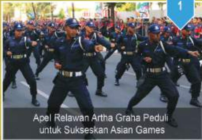
Apel Relawan Artha Graha Peduli untuk Sukseskan Asian Games

18 th ASIAN GAMES Jakarta Palembang 2018