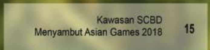
Kawasan SCBD Menyambut Asian Games 2018