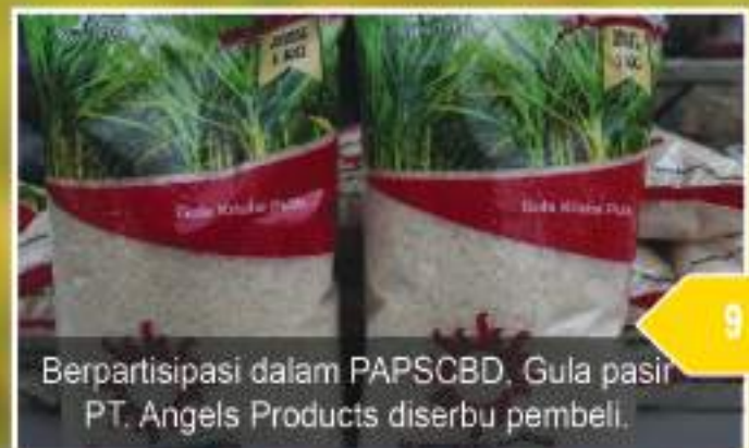
Berpartisipasi dalam PAPSCBD, Gula pasir PT. Angels Products diserbu pembeli.