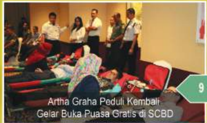
Artha Graha Peduli Kembali Gelar Buka Puasa Gratis di SCBD