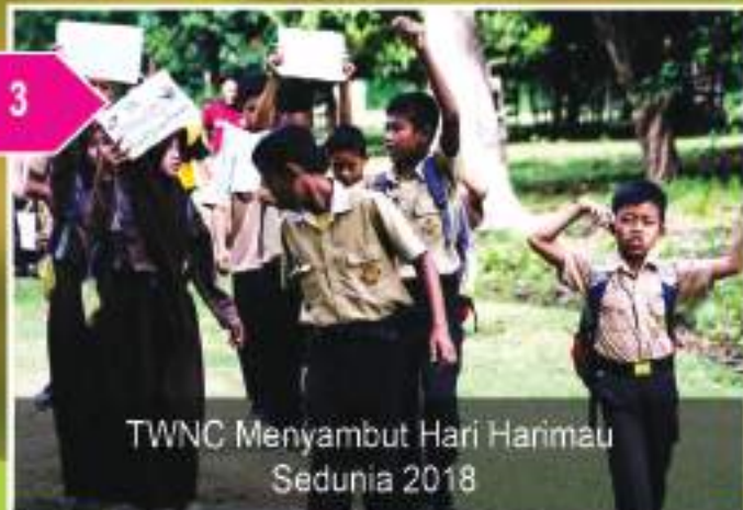
TWNC Menyambut Hari Harimau Sedunia 2018