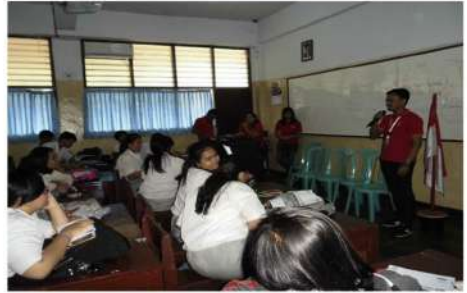
Foto : Sekolah Budhaya Santo Agustinus Jalan Raya Radin Inten II Buaran, Duren Sawit Jakarta Timur

PT. Arthagraha Insurance, mensosialisasikan program literasi asuransi di Sekolah Budhaya Santo Agustinus yang berlokasi Duren sawit, Jakarta Timur, dan SMPN 5 Cimahi Bandung. Upaya tersebut sebagai wujud kontribusi perseroan untuk mendukung Otoritas Jasa Keuangan (OJK) mensosialisasikan asuransi sejalan dengan program Inklusi Keuangan untuk Semua. Dalam kegiatan ini AGGI memberikan edukasi manfaat memiliki asuransi selagi usia masih produktif, dan mengenai pengenalan apa itu asuransi dan manfaatnya. Kegiatan edukasi disambut baik oleh lebih dari 100 siswa dan tenaga pengajar yang turut hadir dan aktif bertanya serta bermain peran menjadi karyawan Asuransi.