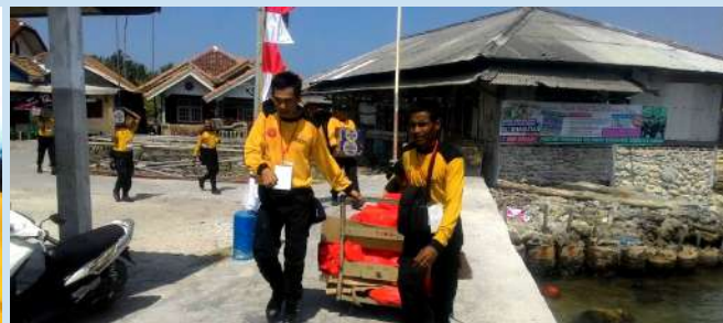
Baksos kesehatan di KRI SUHARSO dilaksanakan mulai 22 s/d 24 September 2017