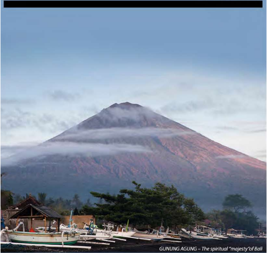
GUNUNG AGUNG – The spiritual “majesty” of Bali