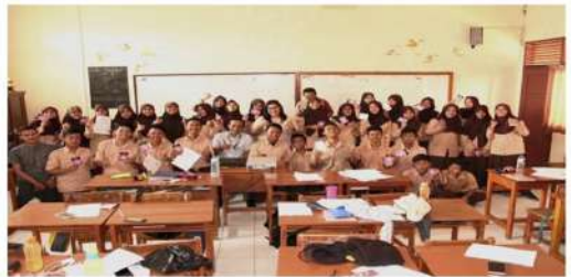
Foto : Lokasi SMPN 5 Cimahi Bandung Jalan Gatot Subroto No. 39, Kota Cimahi 40523( 25/01/2017)

Tim AGGI dari divisi Marketing dan Underwriter dalam presentasinya bertema Apa itu asuransi dan resiko, menjelaskan kepada para siswa, manusia memiliki banyak rencana dan tujuan namun juga penuh ketidakpastian seperti kehilangan pendapatan, impian tidak tercapai, dan biaya hidup tetap harus dipenuhi.