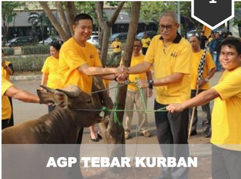
AGP TEBAR KURBAN

SUMBANG HEWAN KURBAN DI KAMPUNG DUL hal. 3