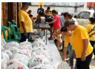
Baksos Pembelian Sembako dan alat tulis sekolah kepada umat serta warga sekitar vihara atta naga vimuti tanjung burung Teluk Naga Tangerang