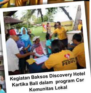
Kegiatan Baksos Discovery Hotel Kartika Bali dalam program Csr Komunitas Lokal