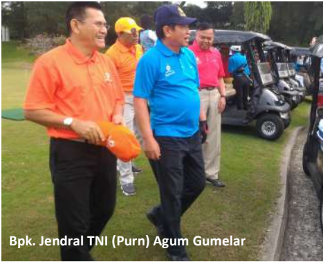
Bpk. Jendral TNI (Purn) Agum Gumelar