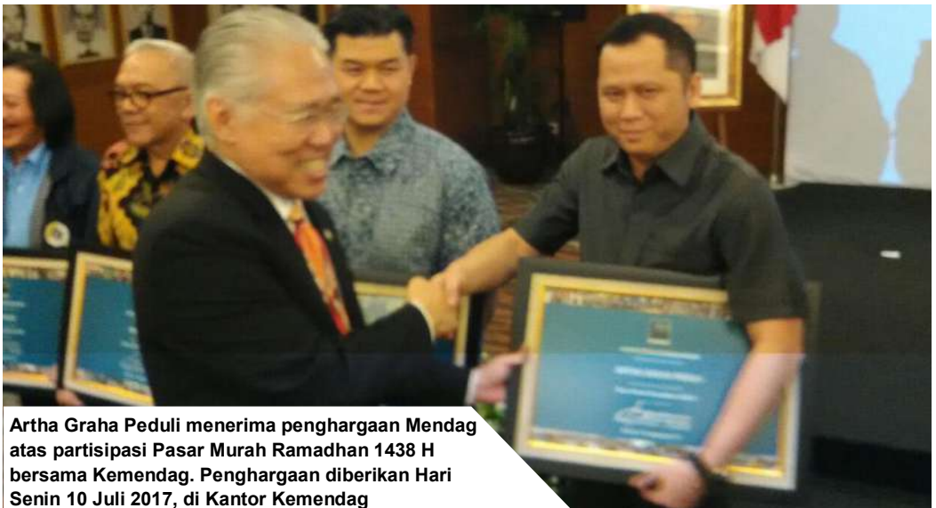
Artha Graha Peduli menerima penghargaan Mendag atas partisipasi Pasar Murah Ramadhan 1438 H bersama Kemendag. Penghargaan diberikan Hari Senin 10 Juli 2017, di Kantor Kemendag