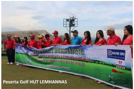
Peserta Golf HUT LEMHANNAS