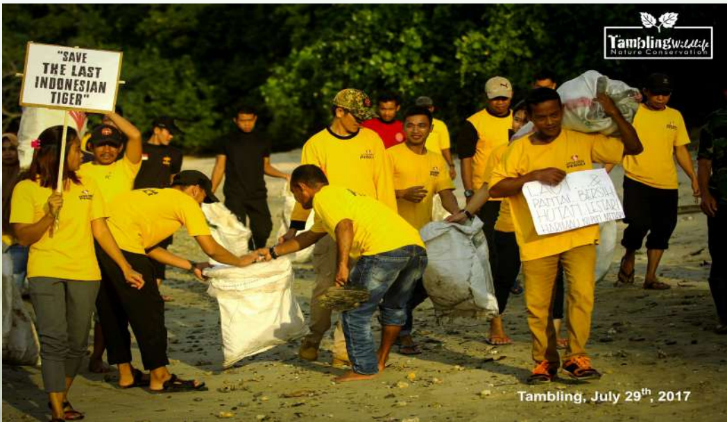
Tambling, July 29 th , 2017

Masyarakat lokal yang ikut serta dalam kegiatan ini yaitu siswa siswi serta guru SDN SATAP 1 dusun pengekahan Desa Way Haru Lampung. Mungkin terdengar cukup asing bagi sebagian orang, namun patut diketahui dengan gedung sekolah yang berada di wilayah terpencil dengan kondisi infrastruktur serta fasilitas sekolah yg terbatas, tak pernah menjadi alasan bagi mereka untuk tidak menjadi generasi penerus bangsa yang berkualitas.